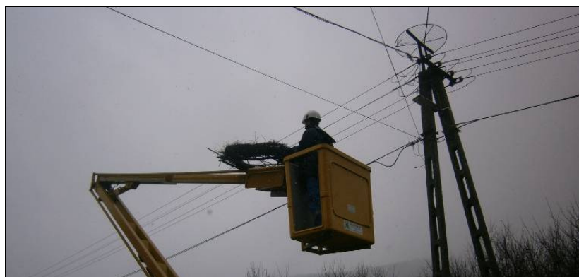
10. kép: Műfészek felhelyezése üres tartóra (András-tanya)

Alsó u. 6.: műfészek felhelyezése üres fészektartóra (2013. 03. 14.)