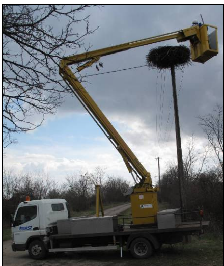
6. kép: A fészkek megemelés előtt.

2013. 04. 11.: Az új fészket elfoglalták a gólyák.