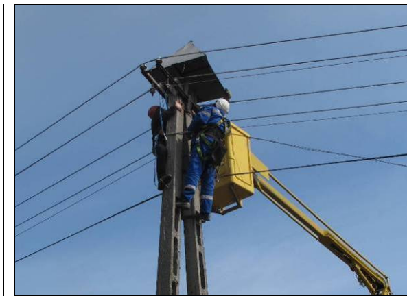
3. kép: Gólyariasztó-gúla felszerelése II.