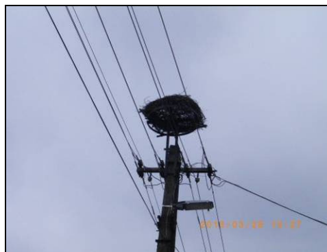
36–37. kép: Fészektartó leromlott műfészkekkel, illetve új műfészek felszerelését követően.