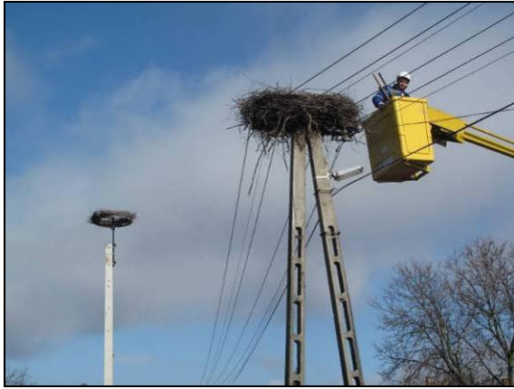
1. kép: Vezetékre épület fészek eltávolítása.

2013.04.11.: Az alkalmatlan helyre visszaépült fészek eltávolítása, riasztógúla felszerelése (2-4 kép).