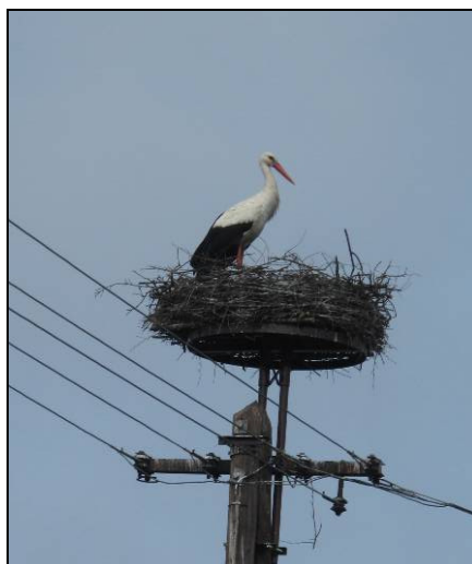
7. kép: A megemelt fészkek 4 héttel később.