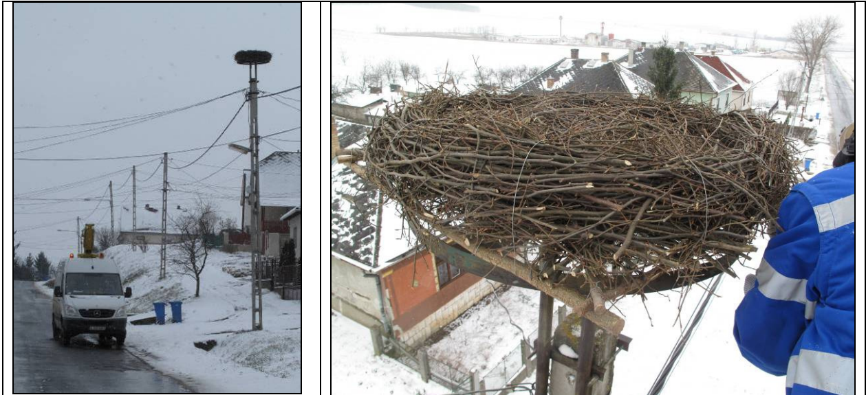
14-15. kép: Műfészkek felhelyezése fészektartóra (Homrogd).

Kossuth u. 9.: műfészkek felhelyezése üres tartóra (2013. 03. 27.).