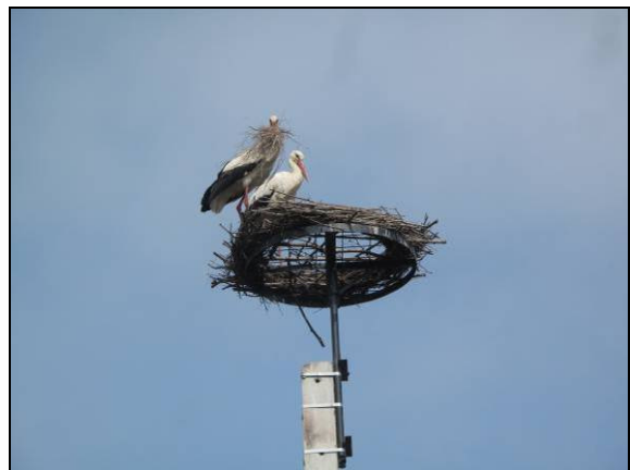
4. kép: Gólyapár az új fészken.

Kossuth u. 9.: üres tartó leszerelése (a használható állapotú tartót máshol használjuk fel – 5. kép)