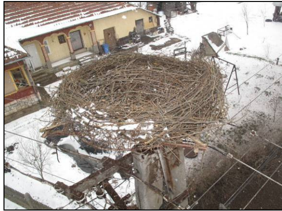
18–19. kép: Túlnőtt fészek lebontás előtt és utána (műfészek felhelyezésével) (Monaj)