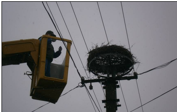
9. kép: Műfészek felhelyezése üres tartóra (Ládbesenyő)

Kossuth u. 22.: műfészek felhelyezése üres tartóra (2013. 03. 14.)