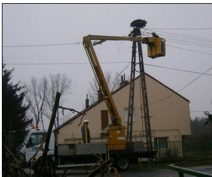
8. kép: Edelény (mentőállomás) – fészkekemelőre helyezett fészkek

Sajószentpéteri u. (mentőállomás): vezetékre épület fészkek lebontása, tartó és műfészek felhelyezése (2013. 03. 14.)