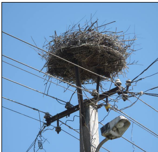
11. kép: Gólyák által visszaépített, korábban lekönnyített fészkek Hétben (2013. 04. 19.)