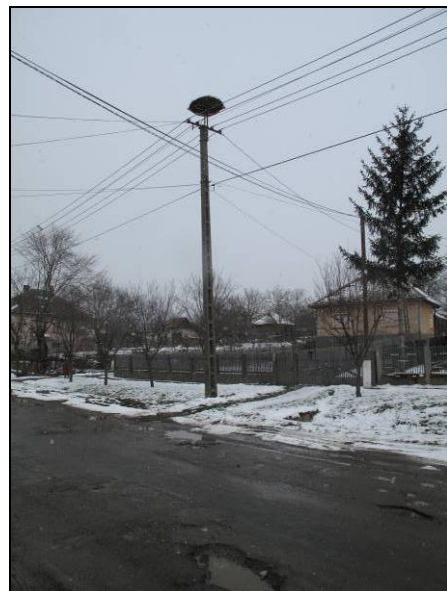
16-17. kép: Vezetékre épült gólyafészkek áthelyezés és tartóra emelés előtt, illetve utána (Selyeb).