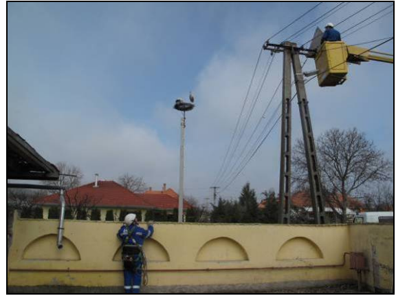
2. kép: Gólyariasztó-gúla felszerelése I.